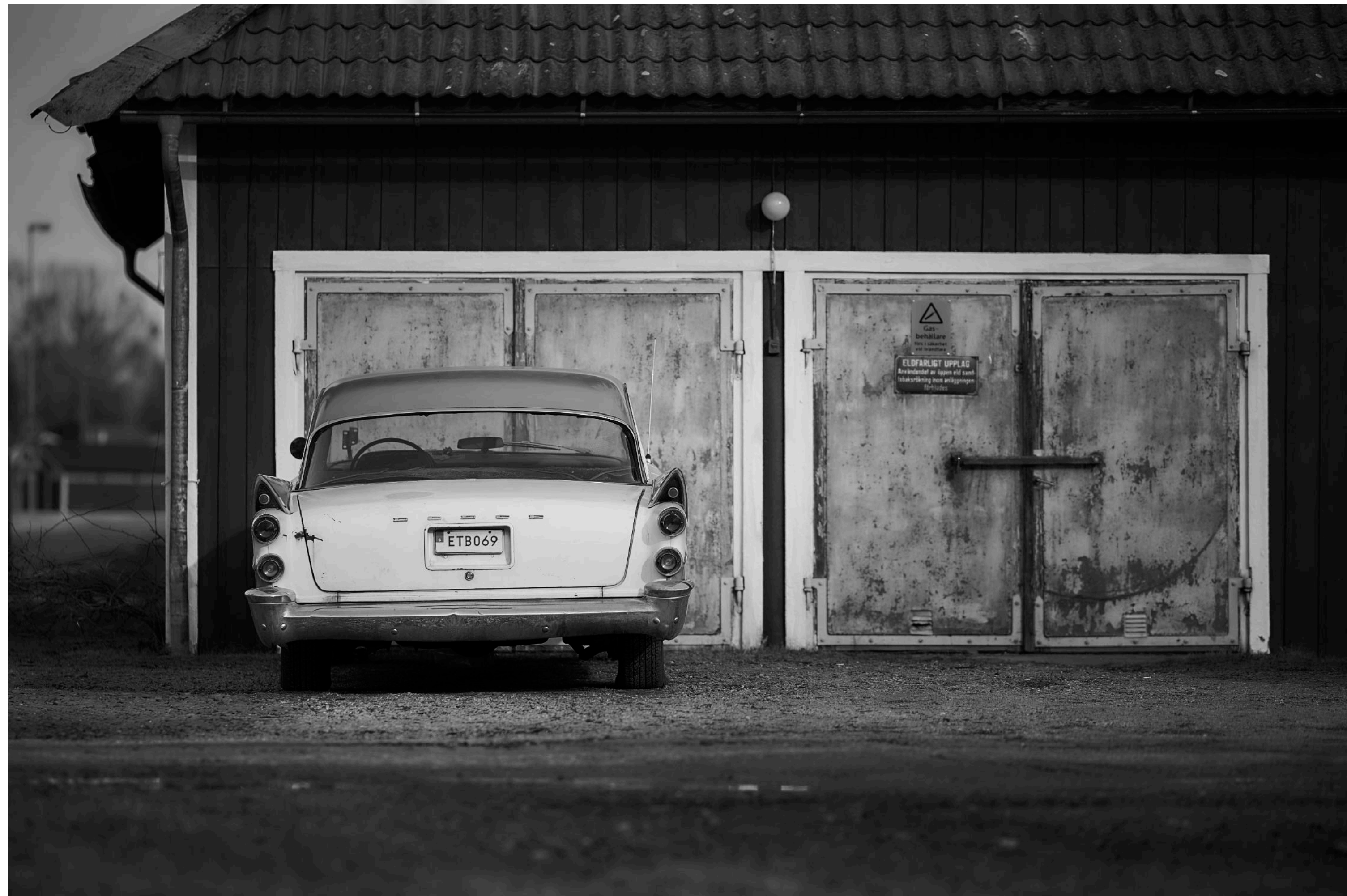
Här står en Dodge och väntar på nästa Cruising.

Störst är nog bilintresset i staden och vilket man kan se på alla veteranbilar som finns här. Varje år anordnas även Arboga Meet då flera hundra bilar går att beskåda i centrum. Den traditionella Cruisingen senare på eftermiddagen som bäddar in hela Arboga i illaluktande avgaser.