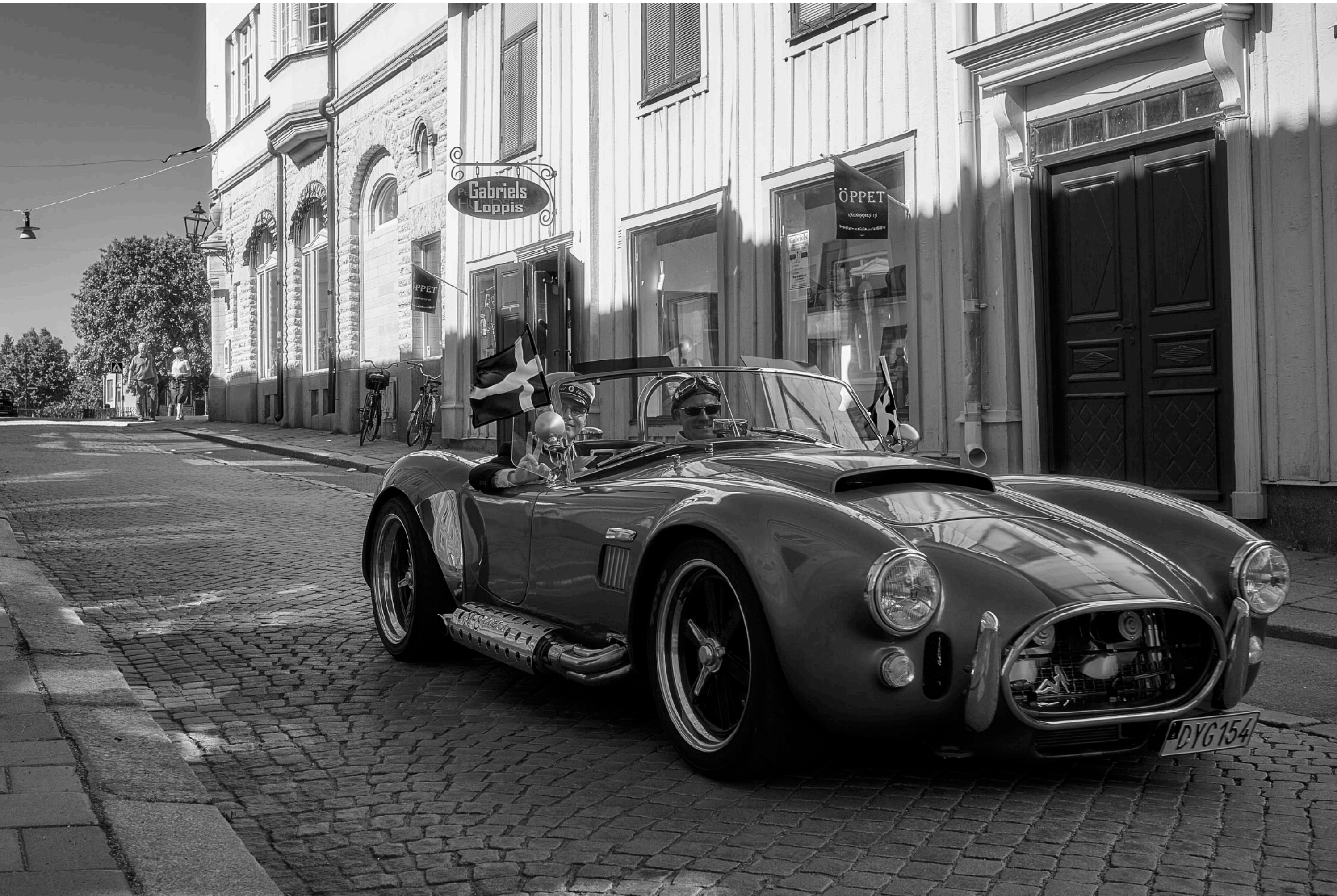
En klassisk sportbil kommer även väl till pass när studenten ska firas.