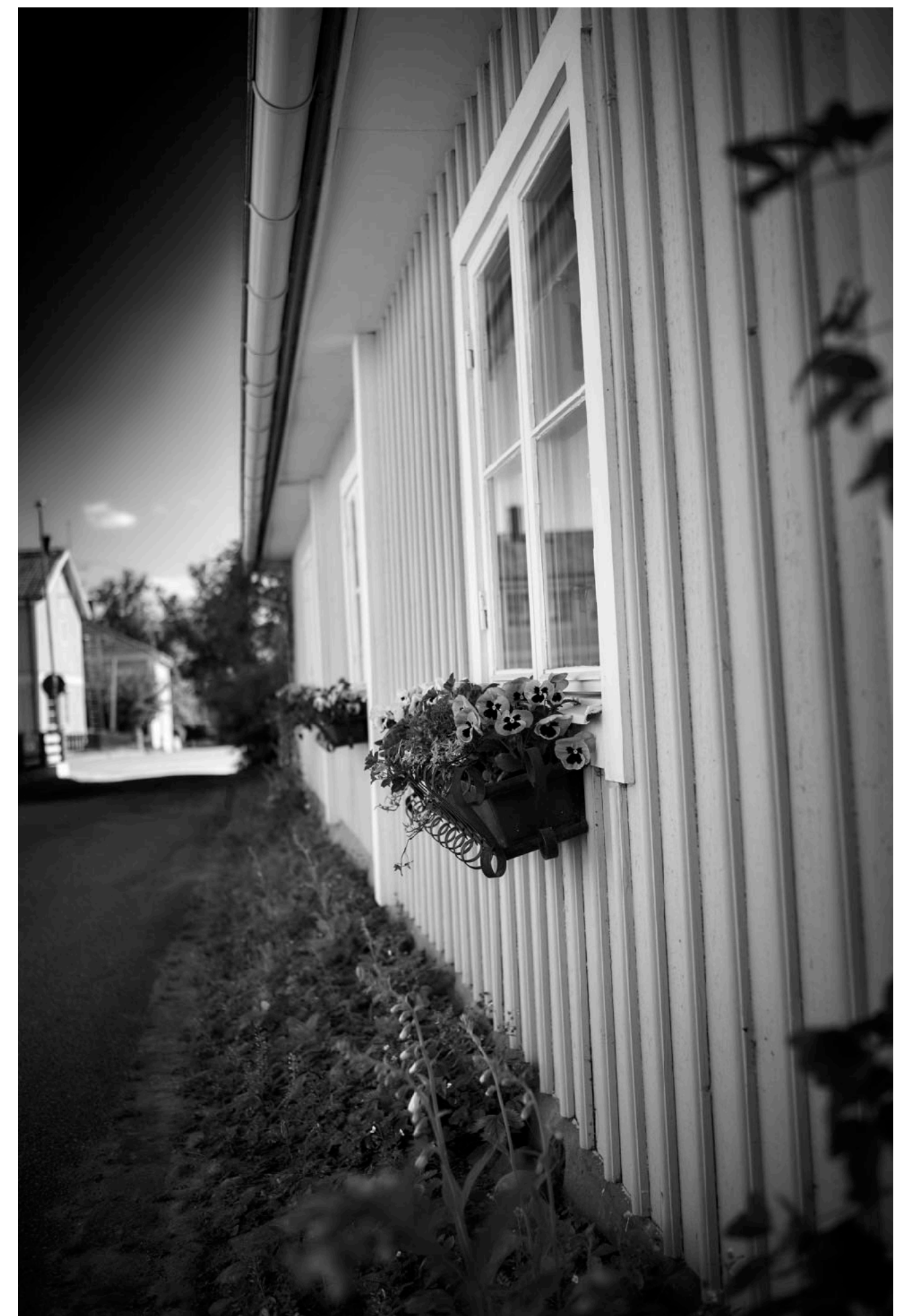
Ett lite nyare men vackert hus på Skepparegränd.