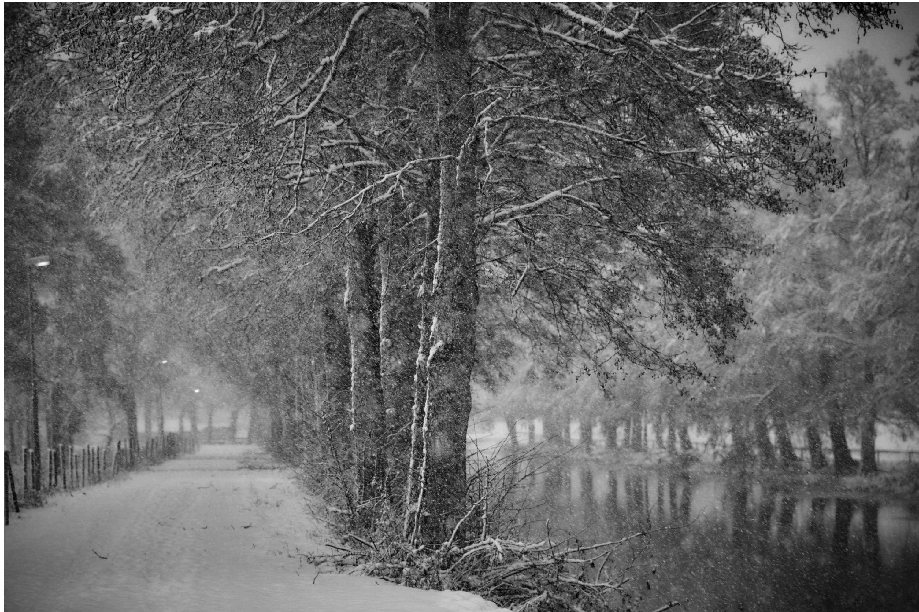
Man kan promenera längs Arbogaån en bra bit västerut även om just den här dagen inte bjuder på så vackert väder.