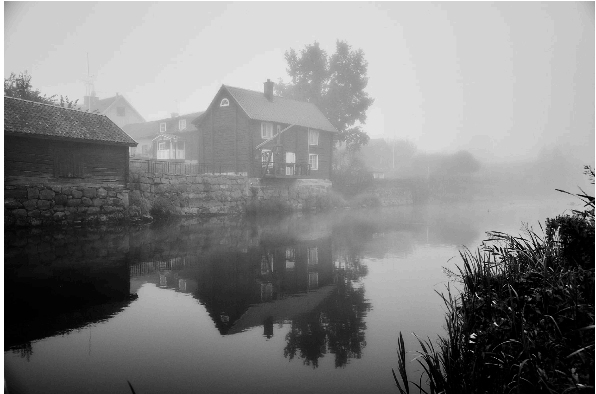
Den här kända vyn kallas för Brüggevyn, lite oklart varför.