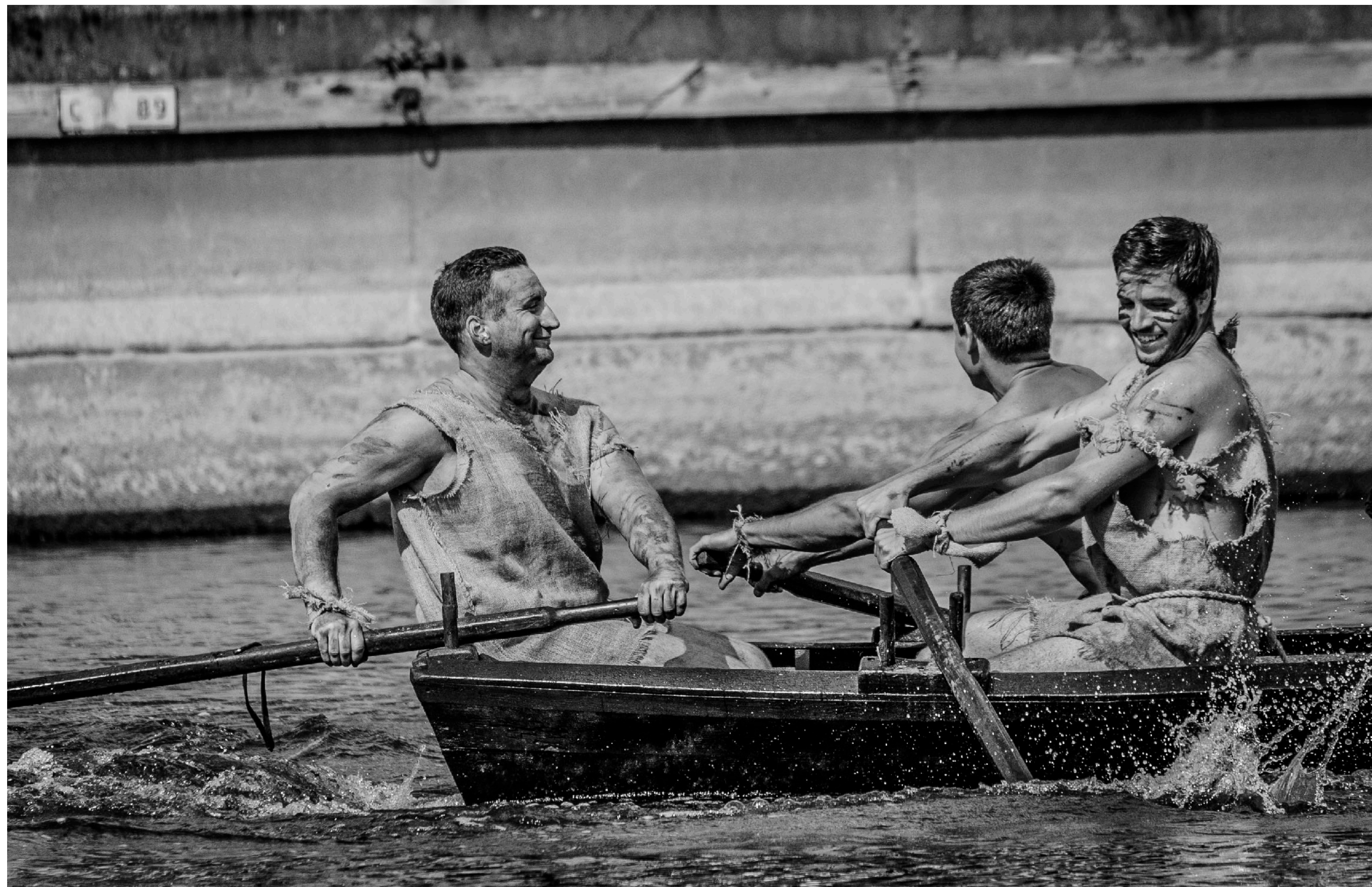
Under medeltidsveckan anordnas även en medeltida rodd. Varje år är det med ett stort leende som hockeylaget tar hem segern.