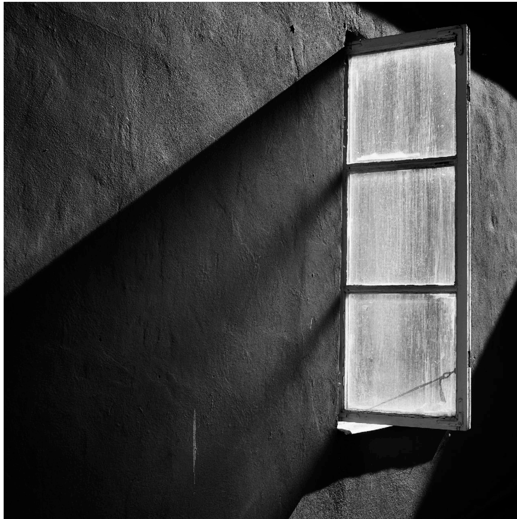
Köket till Pizzeria Viking på Stora Torget behöver få in lite frisk luft.