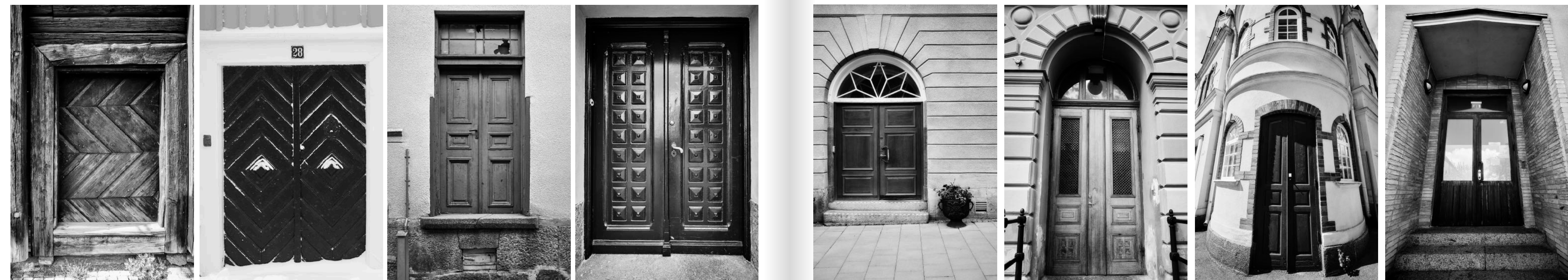
Vackra portar och dörrar från olika tidsåldrar finns det gott om i Arboga.