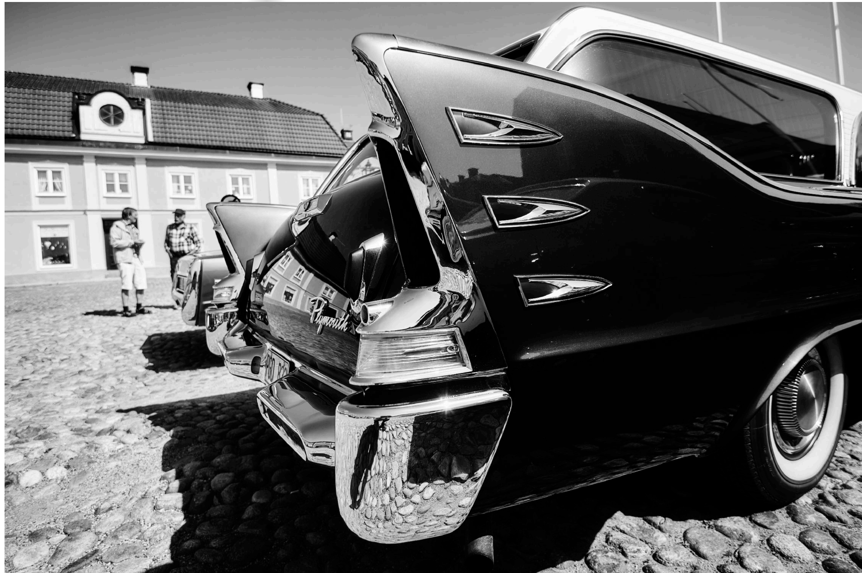
Plymouth från 1960 parkerad på Stora Torget.