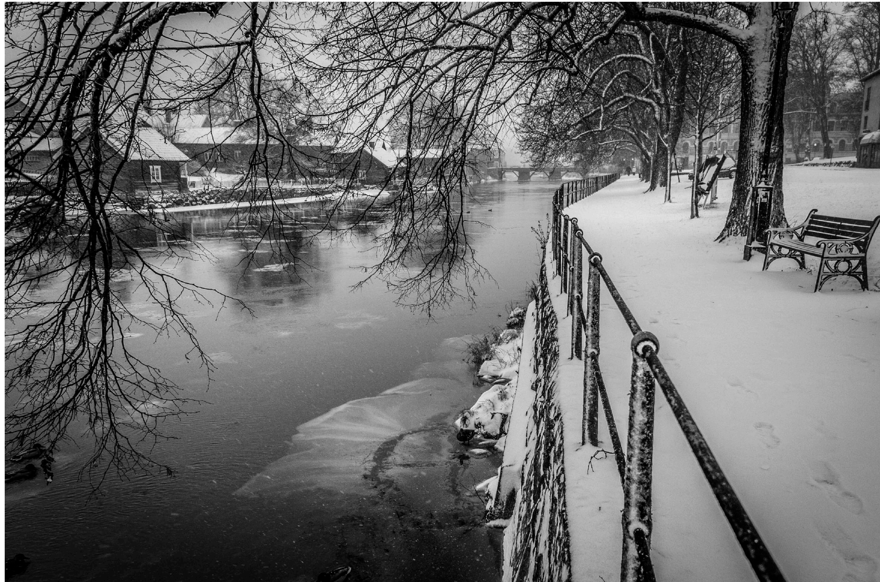
Även vintern har sin tjusning.