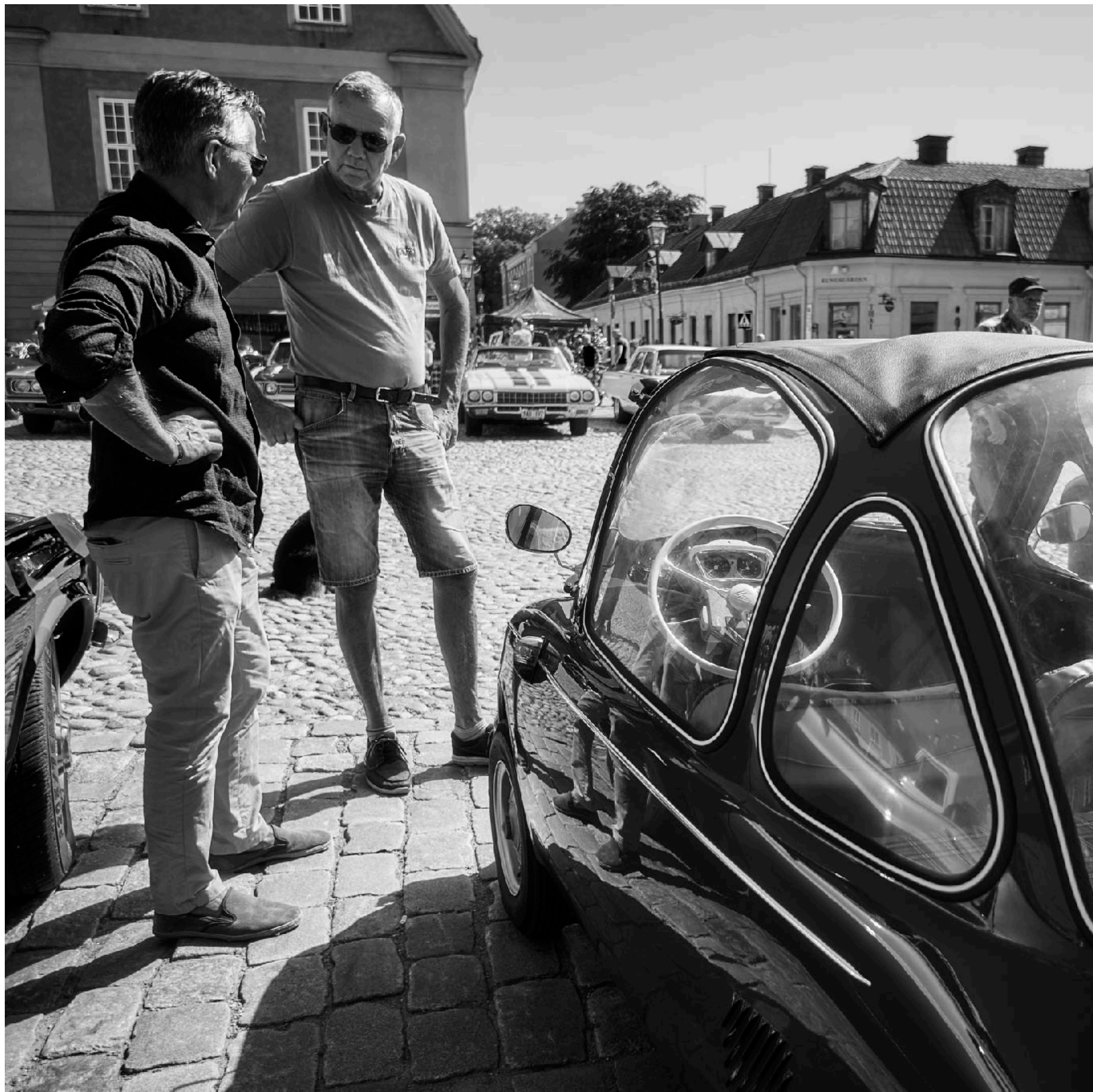
Ett starkt bilintresse är ett bra underlag för många trevliga samtal i sommarsolen.