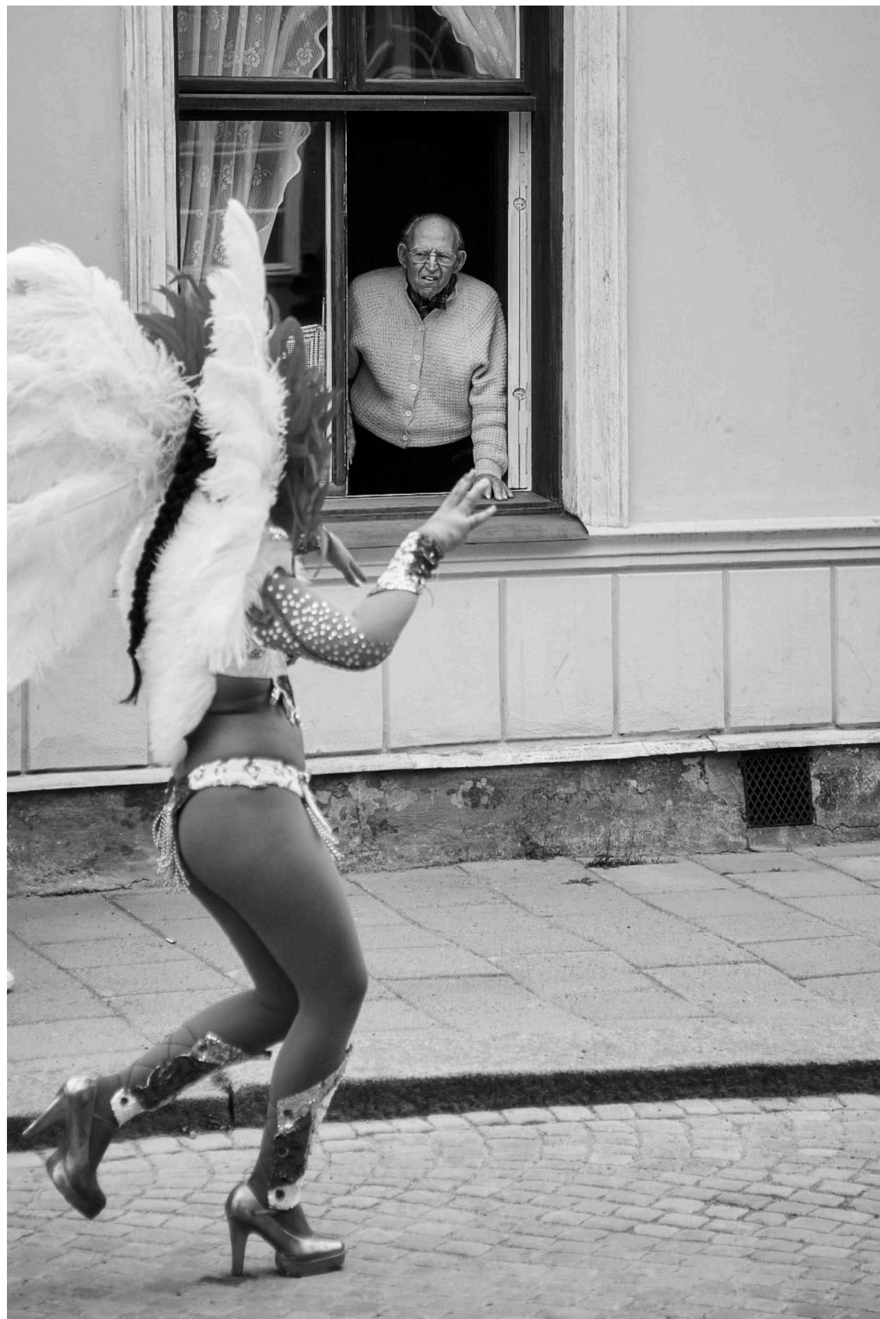
Arbogakarnevalen är också årligen återkommande sedan starten 1992 och lockar många besökare även om en och annan Arbogabo kanske är lite skeptisk till dessa moderna tokerier.