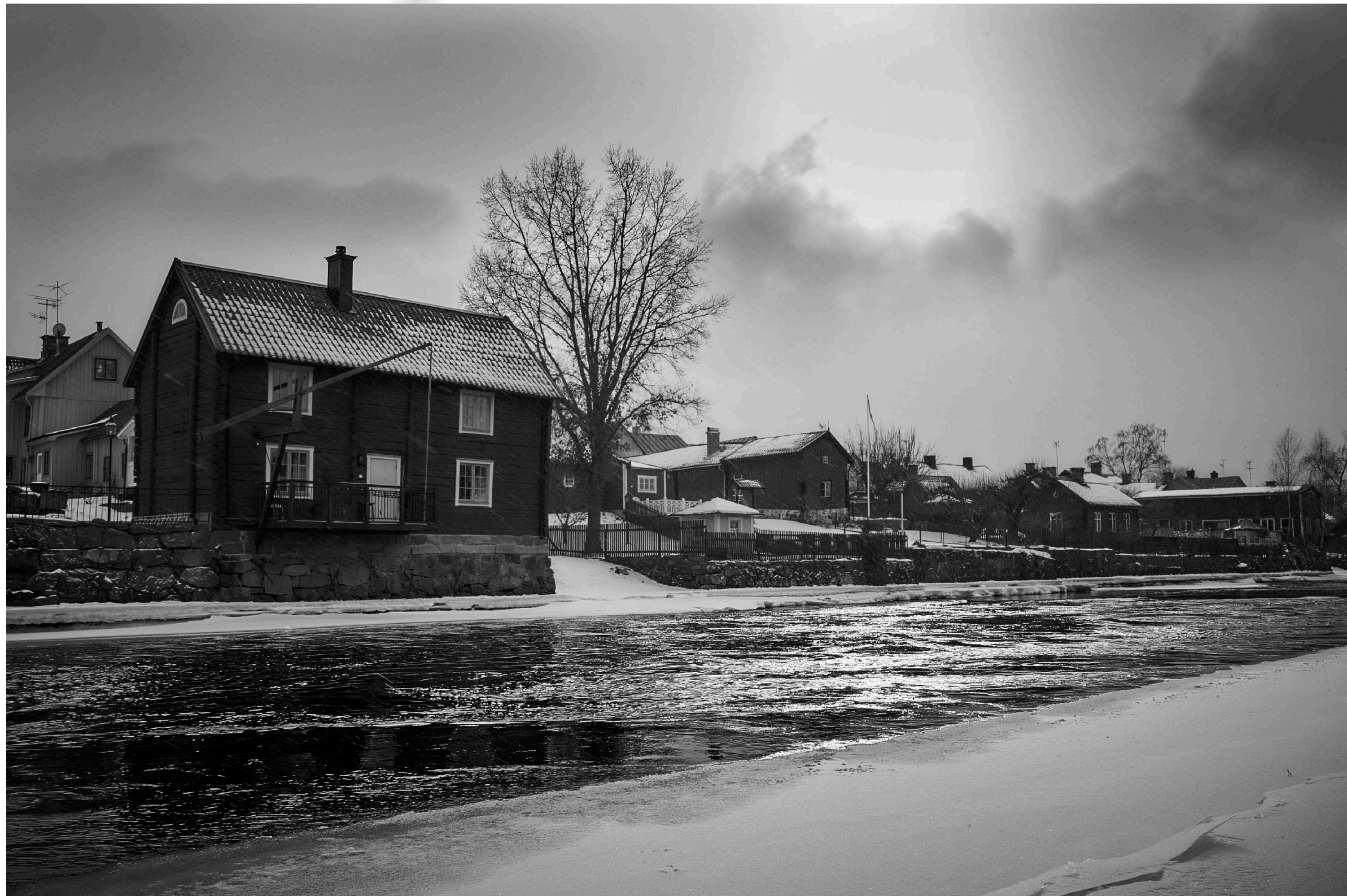
Ytterligare ett hus som har detaljer från den tid då Arboga var en viktig hamn.