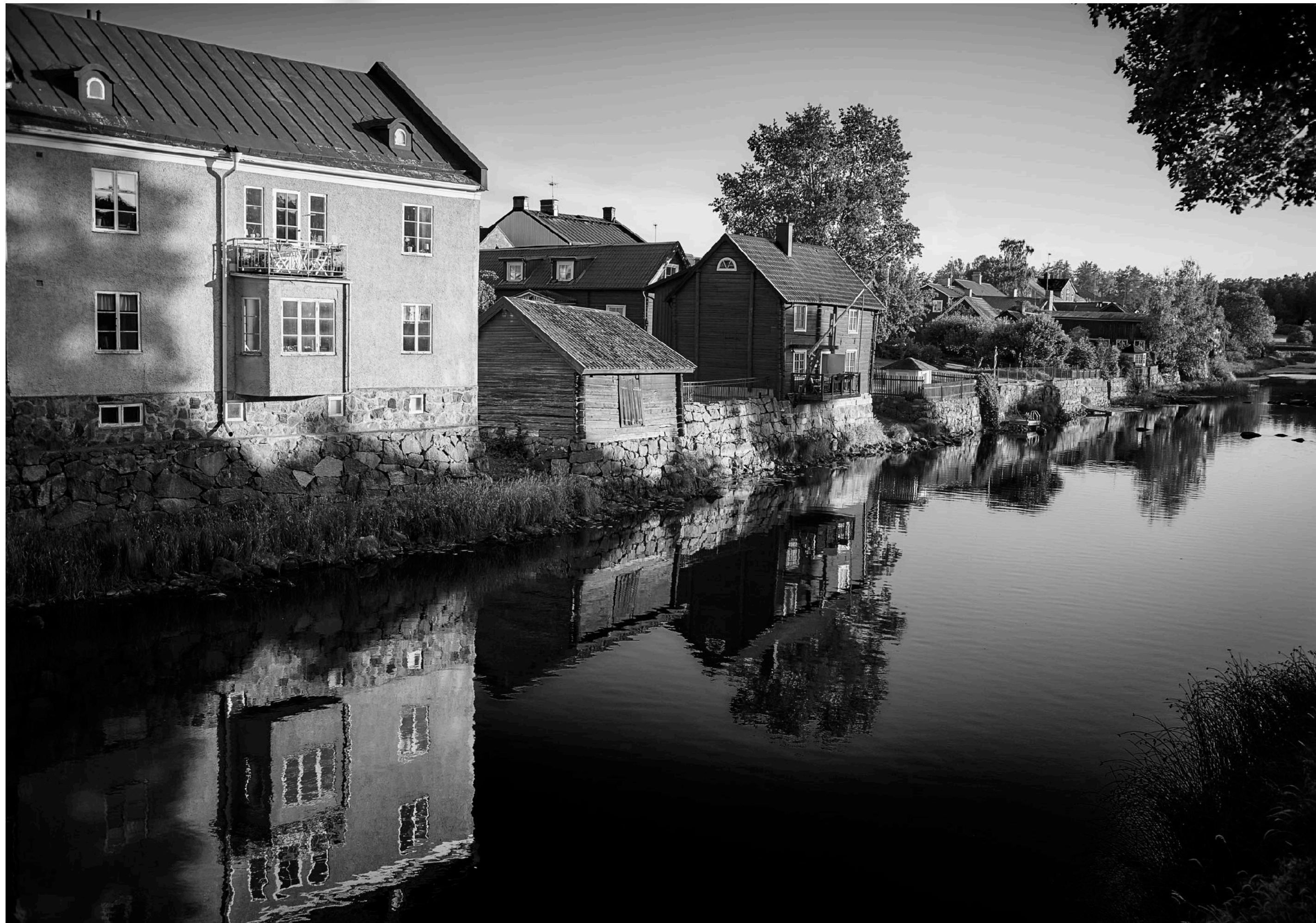
Utsikt från Kapellbron