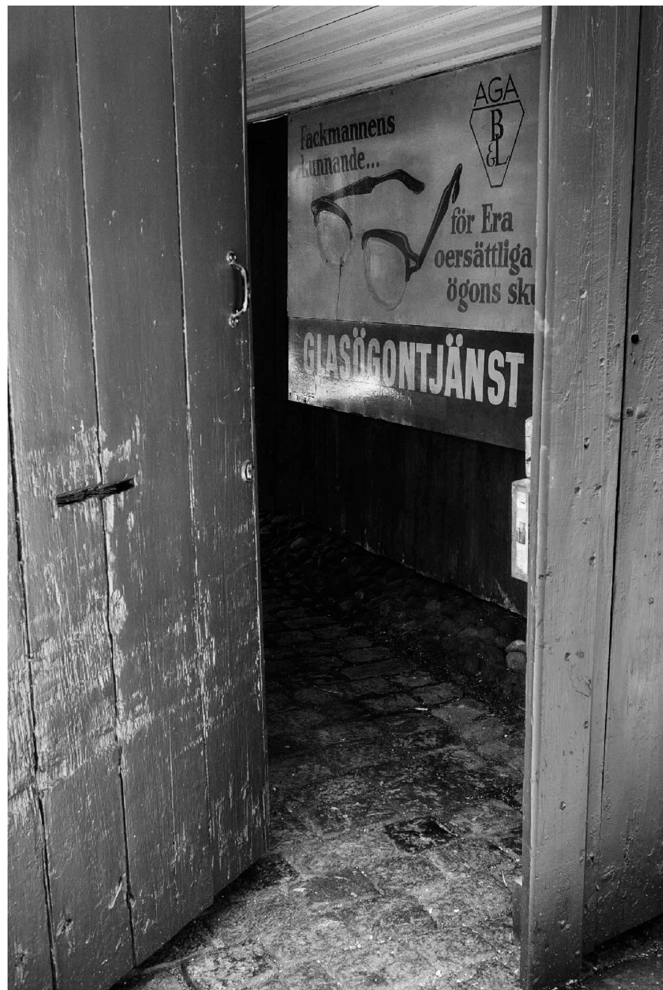
Dörr in till en bakgård på Smedjegatan.