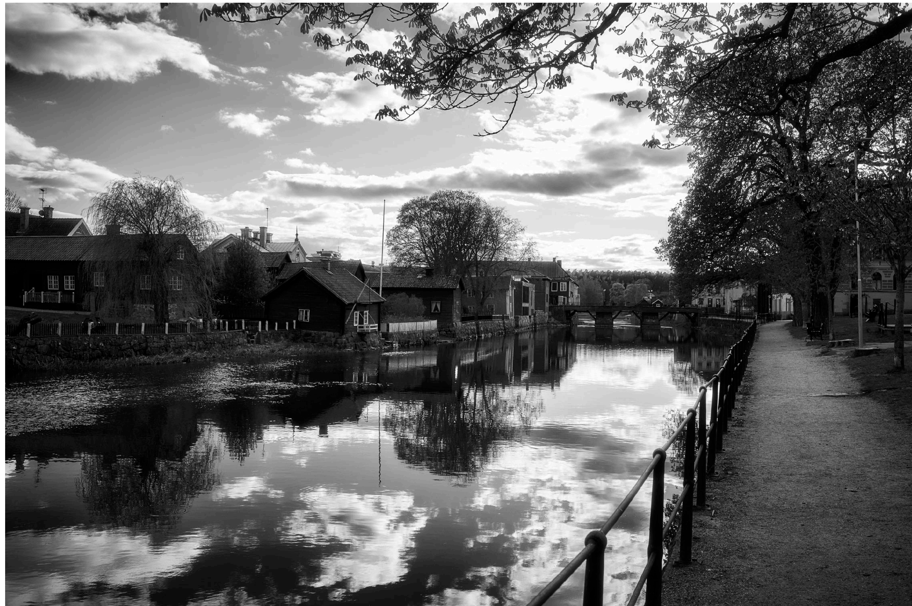
Längs den norra stranden finns ett fint promenadstråk.