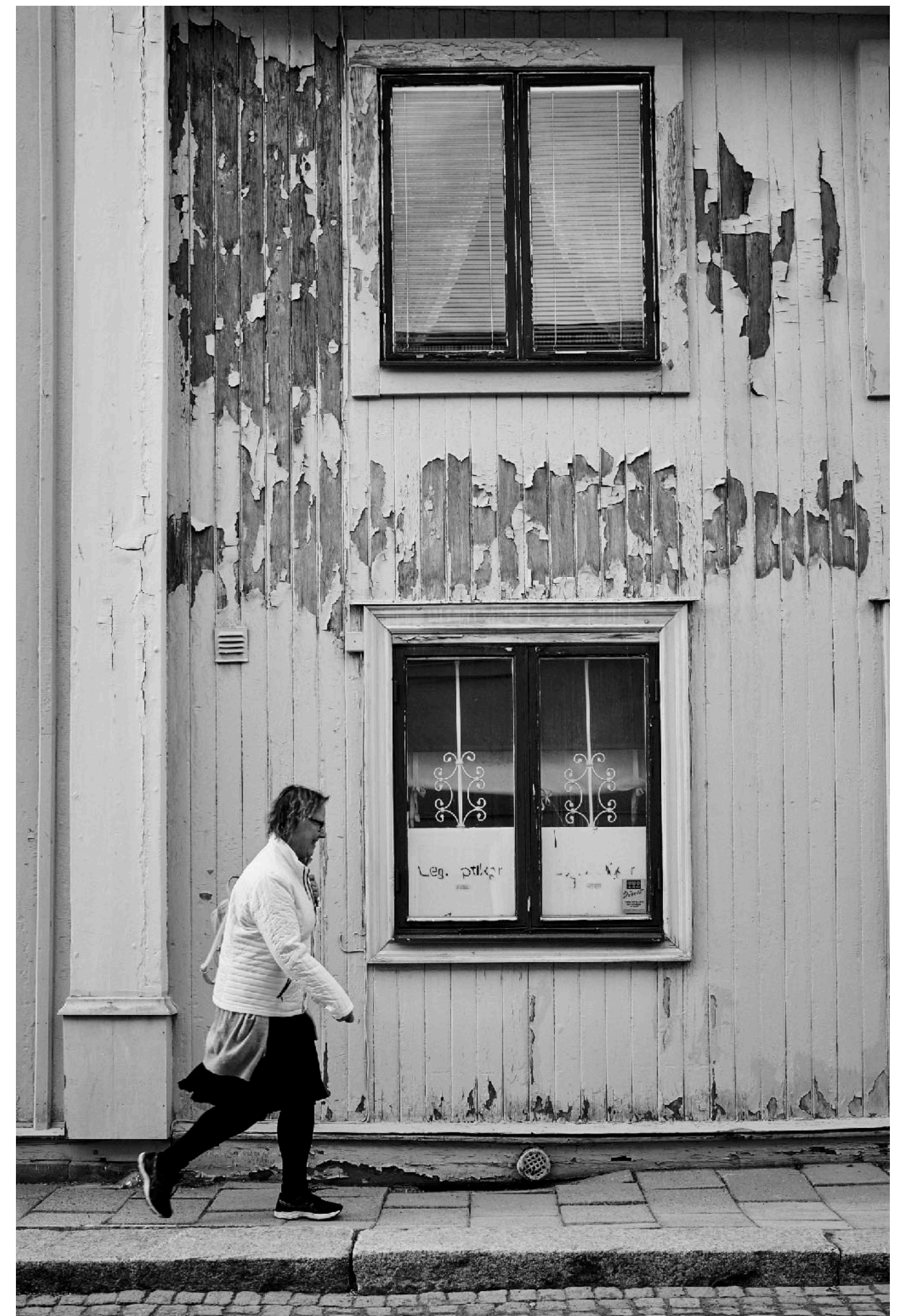
Fasad längs Smedjegatan.

De flesta husen i staden är av trä och en del är väldigt gamla. Det äldsta bevarade huset stod färdigt redan på 1200-talet men de flesta husen är mycket yngre men behöver en hel del underhåll i alla fall.