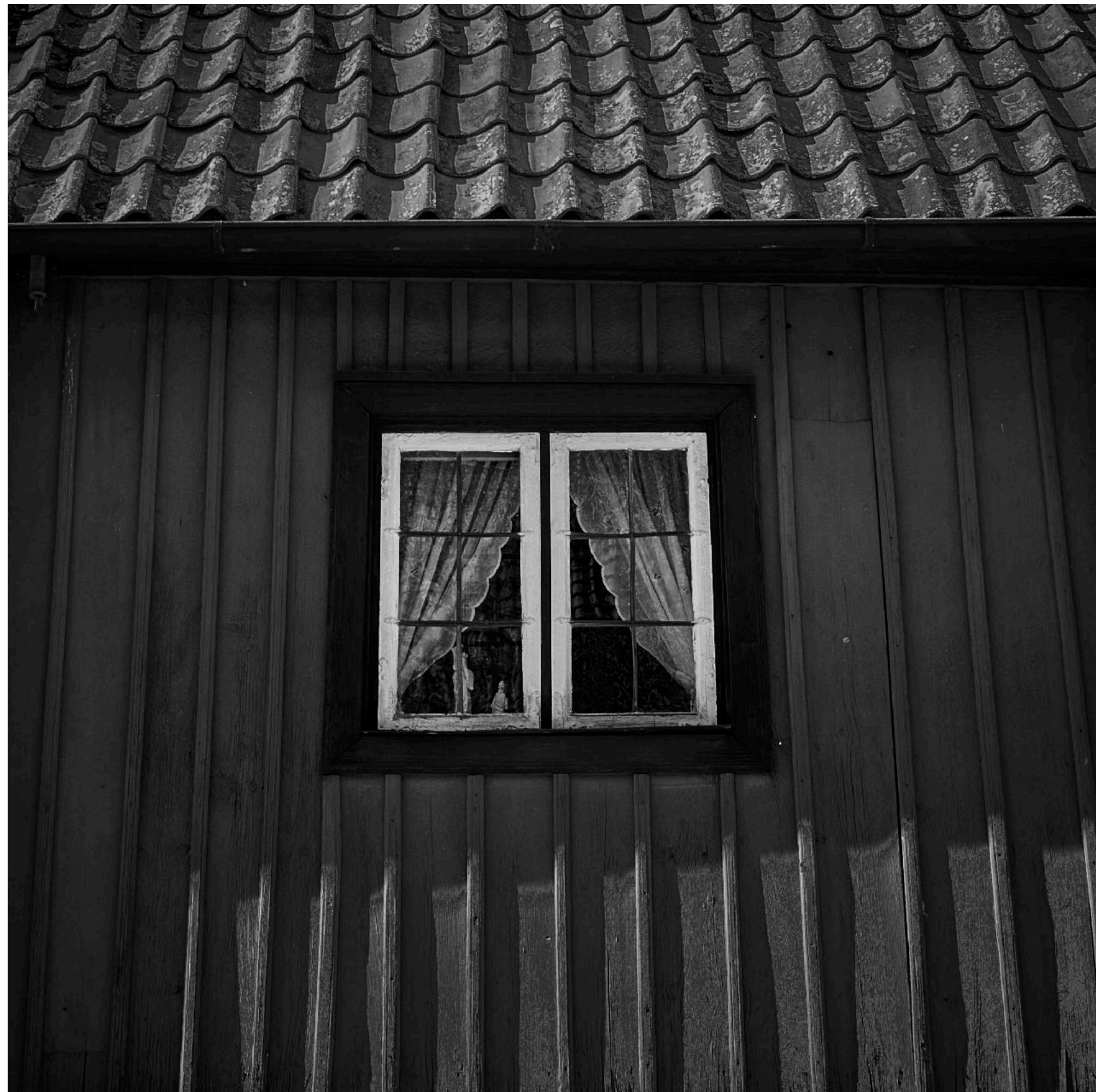
Hus med vackra gardiner på Storgatan.