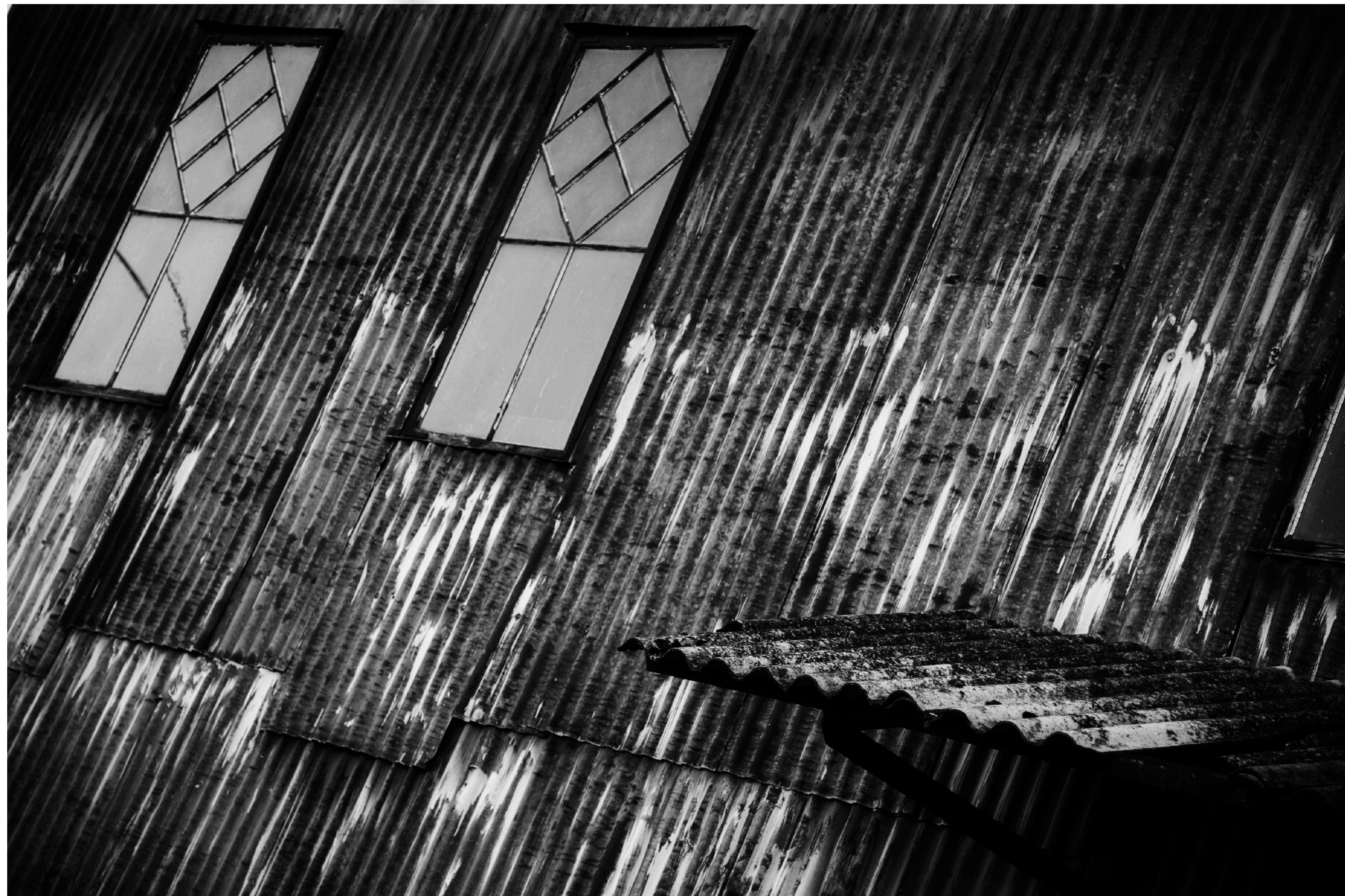
En verkstadslokal längs Norra Ågatan i Arboga.

Det finns gott om små företag och verkstäder i Arboga och en del är inhysta i byggnader som behöver en rejäl upprustning innan de faller ihop.