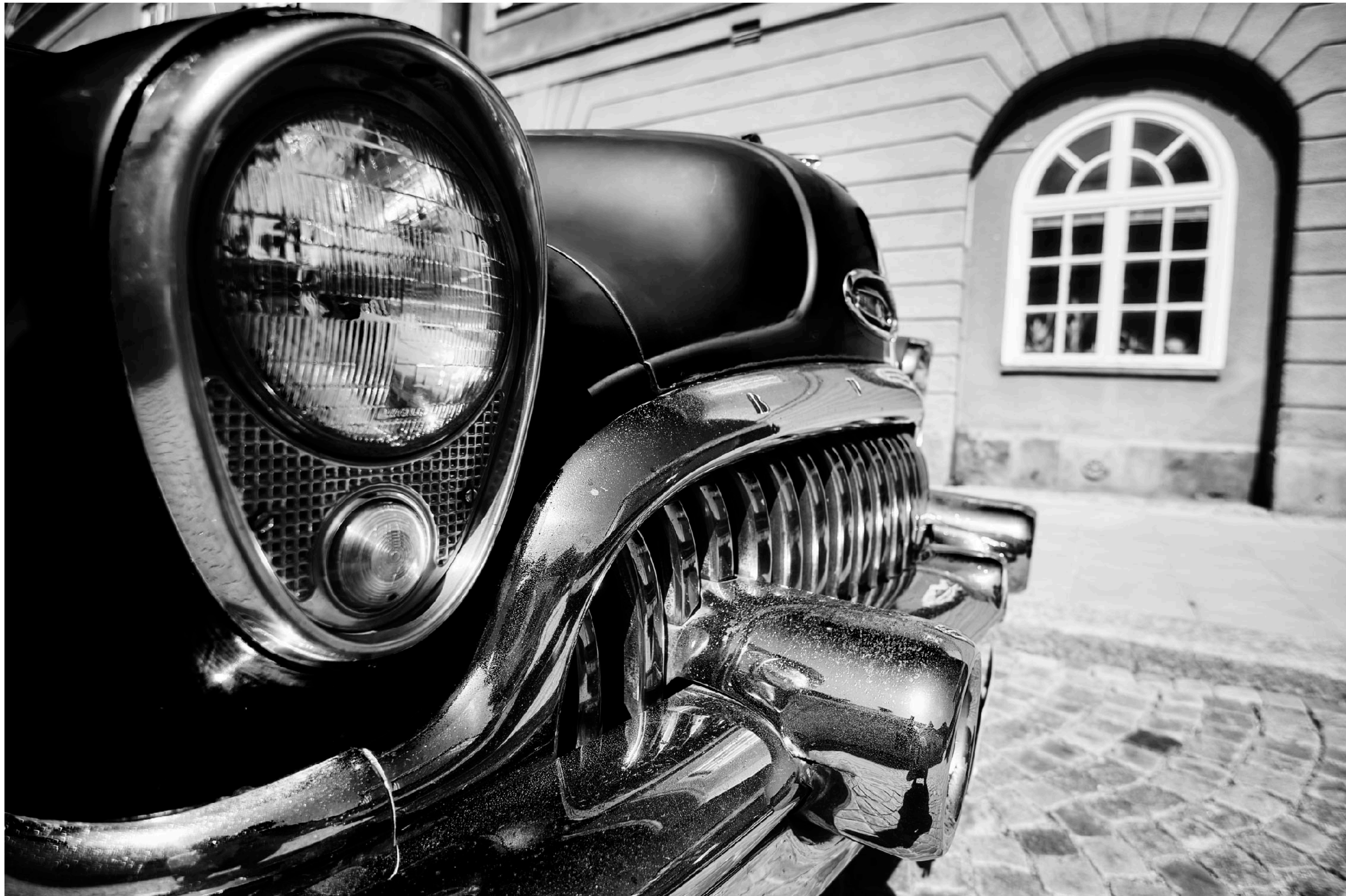
Buick Super 8 parkerad utanför rådhuset.