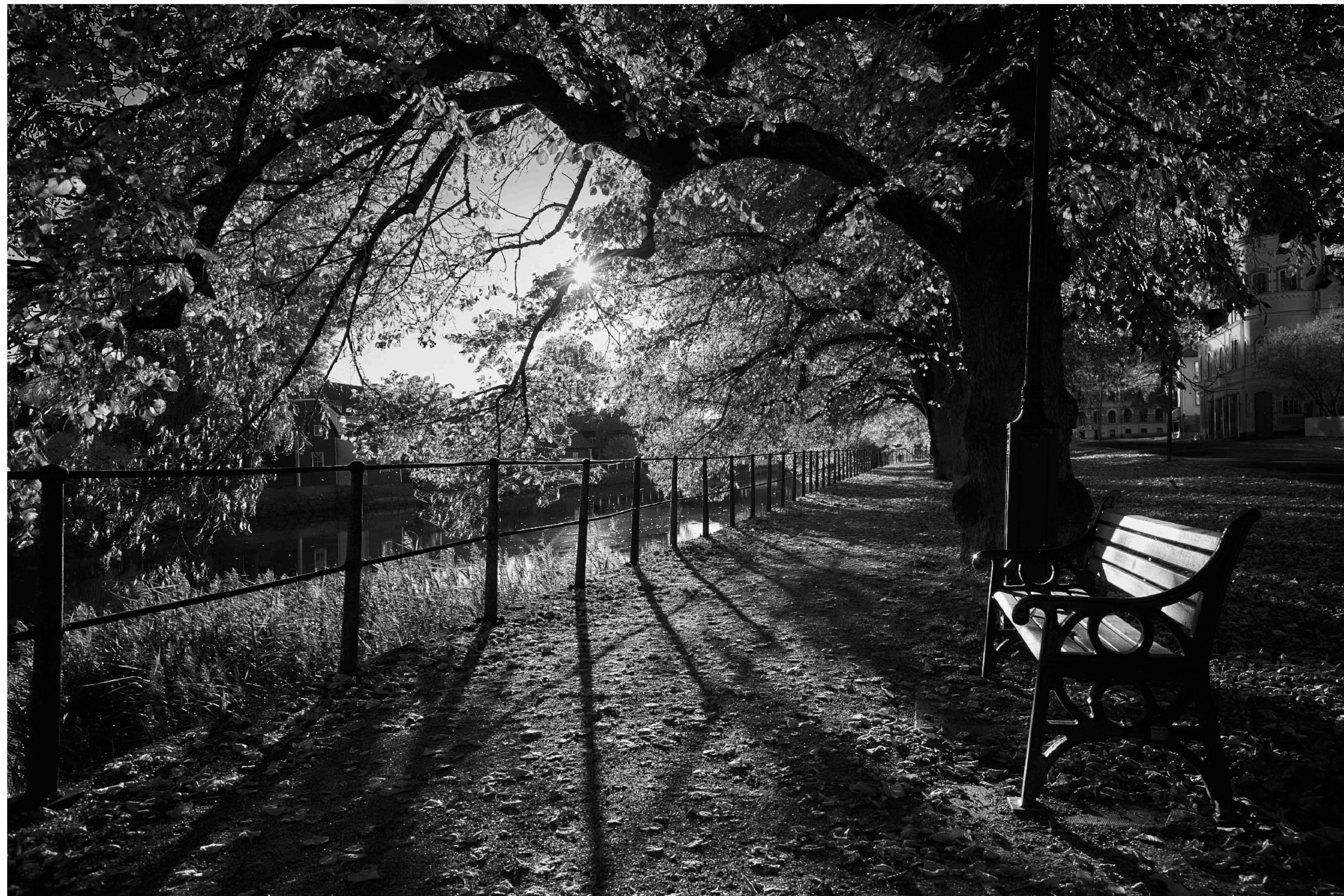
Det är också mycket trevligt att promenera här på soliga höstdagar.