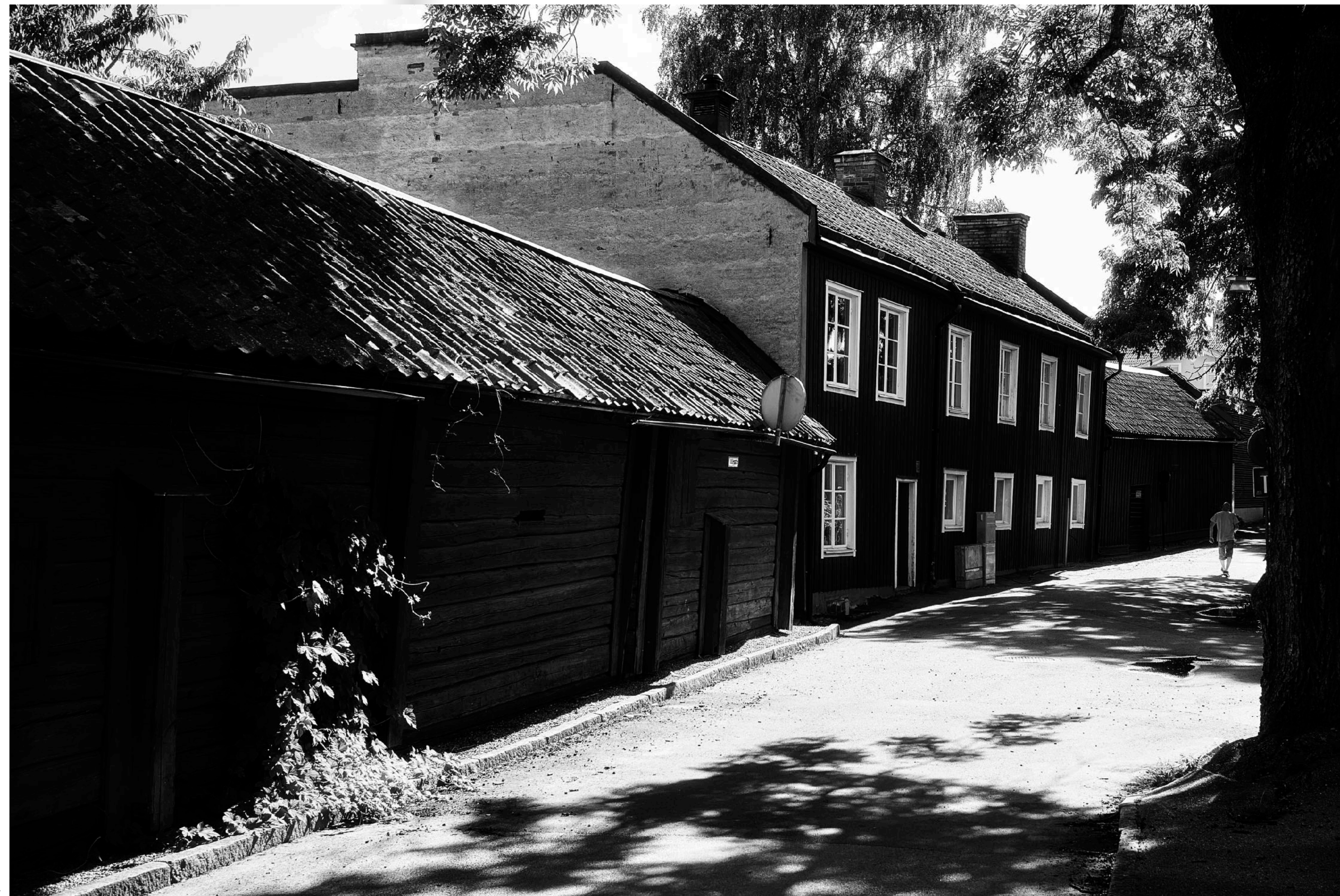
Pittoreska hus längs Ahllöfsgatan.

Jag hoppas ni nu också tycker att Arboga är värt ett besök. Vackrast förstås på sommaren men ni är välkomna när som helst. Vi ses!